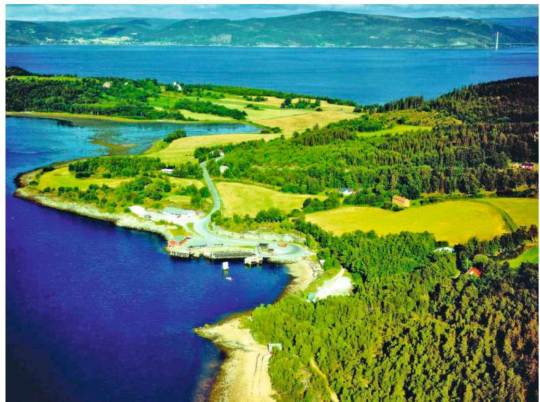
Fergeleie på Ytterøy

Flere kreative sjeler har skapt sitt eget virke, og etablert egne bedrifter innen glassmaling, rådyrskinnprodukter og tredreining for å nevne noe.