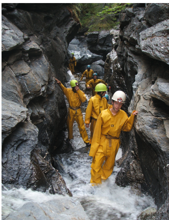
Grottevandring i Mokk, Ogdal