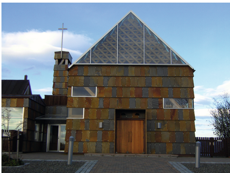
Mariaklosteret på Tautra

Norges sjette største innsjø ligger rett nord / øst for Steinkjer. Med E6 på den ene siden og 763 på den andre kan man uten problem få til en spennende dagsutflukt. Kjør E6 opp til Snåsakroa og stopp hos en av Norges beste veikroer for litt kaffe ev annet påfyll. Rett nord for Snåsakroa tar dere av mot Snåsa sentrum. Her anbefaler vi besøk hos en seter, Saemien Sijte, Gjerstadhuset og Kafe Midtpunktet. Lunsjen passer fint her og på veien tilbake må dere ta en tur innom Bøla-Bua, se Norges best kjente helleritning i utlandet og her kan dere nyte en deilig middag.