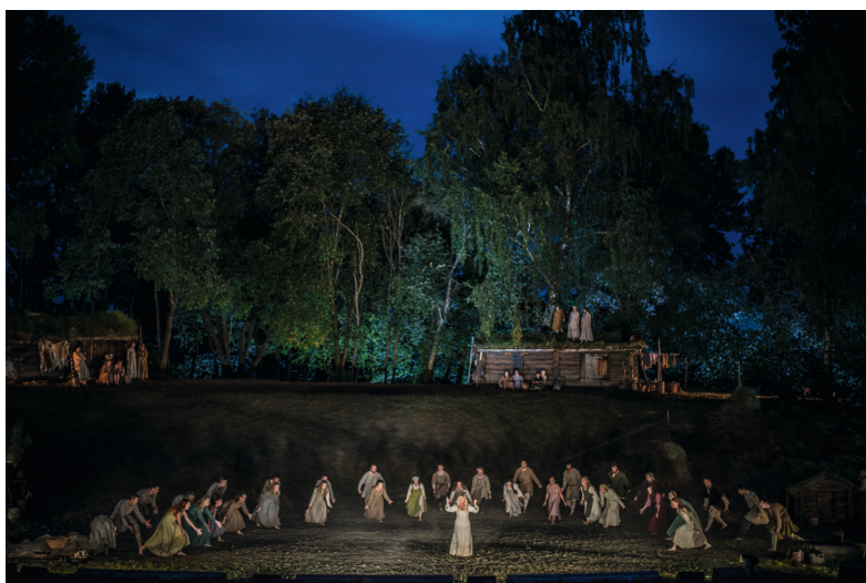
Spelet om Heilage Olav, Stiklestad

Idag er historieopplevelsene mange på Stiklestad. Mest kjent er Nordens største og Norges eldste friluftsteater "Spelet om Heilage Olav", som er knyttet til begivenhetene før og etter slaget. Spelet fremføres årlig under festivalen "Olsokdagene på Stiklestad" i slutten av juli. Under Olsokdagene på Stiklestad syder det av liv og du kan oppleve konserter, teaterforestillinger, foredrag, omvisninger, utflukter og aktiviteter for hele familien. I tillegg kan du besøke vårt middelaldermarked hvor du kan oppleve middelaldermusikk, gjøgling og teater. I telt og boder sitter gode handverkere fra hele landet i tidsriktige klær og demonstrerer sine ferdigheter. Daglig vil det være aktiviteter for store og små.