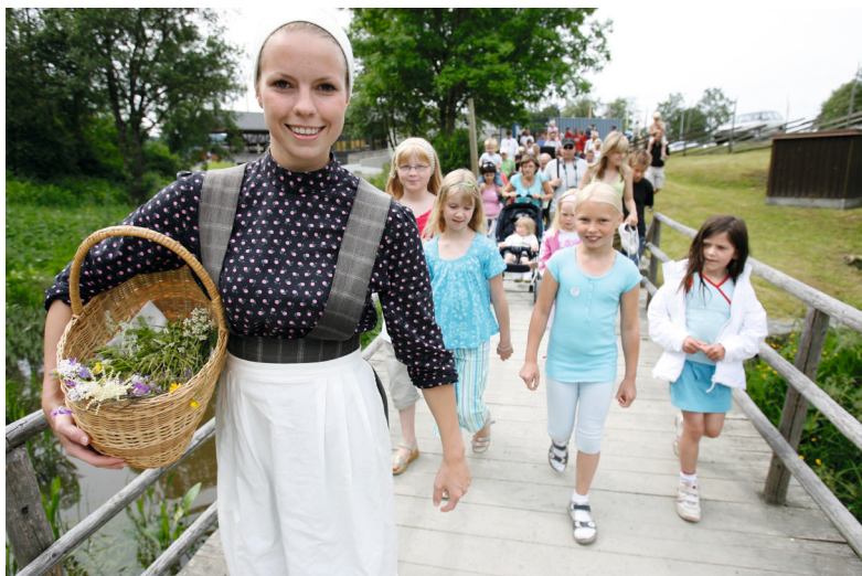
Stiklestad Nasjonale Kultursenter

Byvandring – bli med på en spennende vandring hvor du oppdager Steinkjer med nye øyne. Avsluttes ved torget og Steinkjer kirke fra 1965. Varighet ca. 1 time.