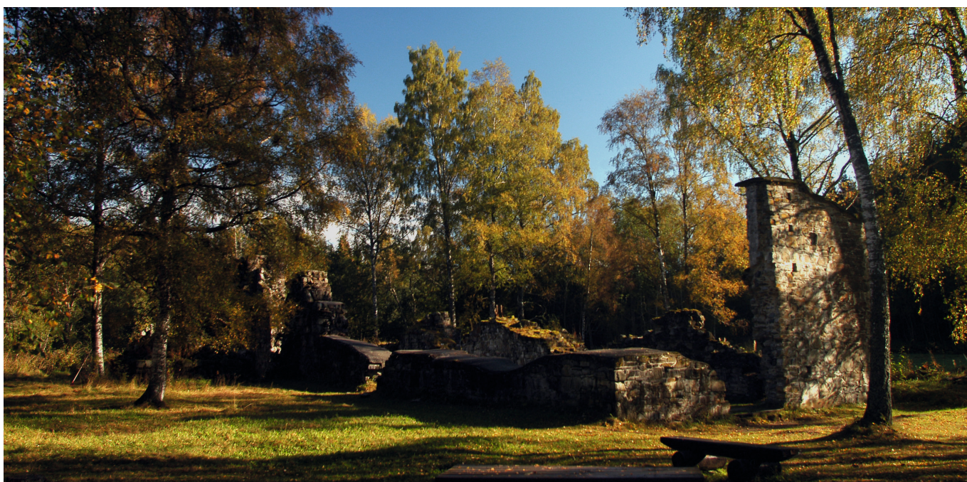
Ruinene ved Munkeby

Historiske Innherred har mange lag. Som ringer i vann har arven etter Olav Haraldsson gjort seg gjeldende på ulike vis opp gjennom århundrene. Munkeby Mariakloster og Tautra Mariakloster er i dag moderne klostre med historiske røtter tilbake på 1200 tallet. En kikk inn i deres hverdag er interessant og byr kanskje på noen overraskelser.