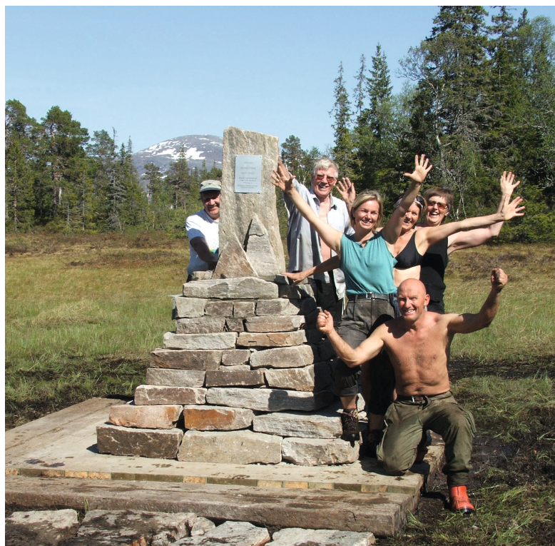
Norges grafiske Midtpunkt, Ogndal

Stien går i noe stigende, men lett terreng. Det er godt egna for en dagstur.