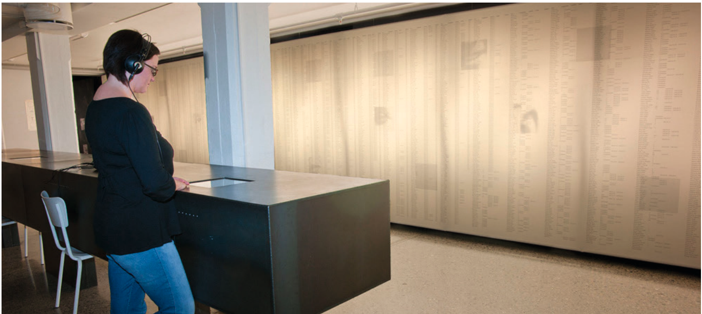
Minneveggen ved Falstadsenteret

Falstadsenteret i Levanger er et nasjonalt senter for andre verdenskrigs fangehistorie og menneskerettigheter. Falstadsenteret er et minnested og senter for menneskerettigheter. Her finner du en fast museumsutstilling, samt temporære utstillinger. Du finner også en stor samling med fotografier fra krigsårene og den første tiden etter frigjøringen.